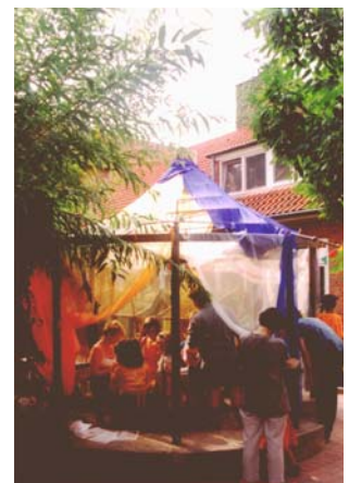
Vicelin Kindergarten - Aussenanlagen